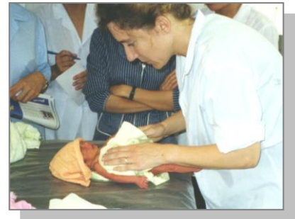
Isabelle à la Maternité

Il s'agirait donc de sélectionner un pédiatre s'occupant spécifiquement des nourrissons, d'attribuer une salle à l'activité Kangourou, et de renforcer la formation du pédiatre nommé grâce à la venue d'un pédiatre Lampions.